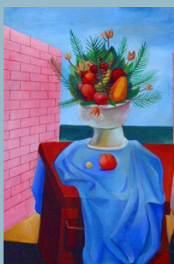
Di Cavalcanti. Natureza-morta. 1966. Óleo sobre tela. Acervo dos Palácios