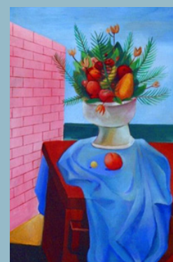
Di Cavalcanti. Natureza-morta. 1966. Óleo sobre tela. Acervo dos Palácios