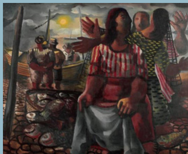
Di Cavalcanti. Pescadores. 1942. Óleo sobre tela. Acervo dos Palácios