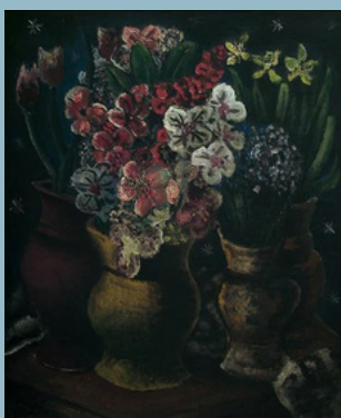
Di Cavalcanti. Vaso de flores. 1936. Óleo sobre tela. Acervo dos Palácios

Que tal conhecer um pouco das obras desse grande artista ao mesmo tempo aproveitar para exercitar a memória? Para jogar, você precisará recortar as imagens.