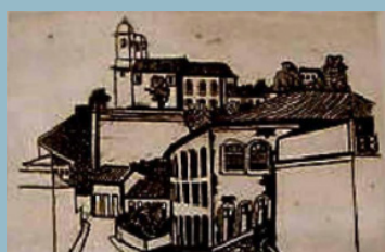
Di Cavalcanti. Sem título. Sem data. Calcogravura sobre papel. Acervo dos Palácios