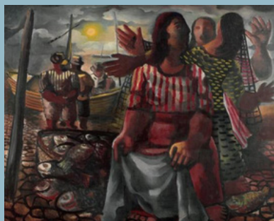
Di Cavalcanti. Pescadores. 1942. Óleo sobre tela. Acervo dos Palácios