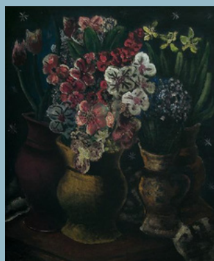
Di Cavalcanti. Vaso de flores. 1936. Óleo sobre tela. Acervo dos Palácios